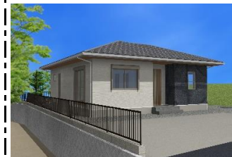
【イメージパース図】

土地 = 794万円 建物+付帯工事+外構(130万円想定) = 1,750万円 合計 2,544万円