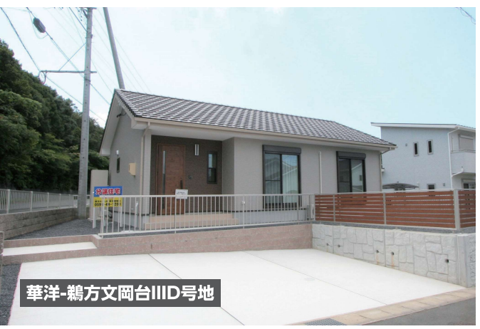
華洋-鷺方文岡台IID号地